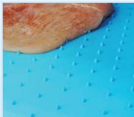
Volta (Spike) Bänder