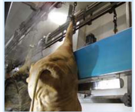
Transport von schweren Produkten