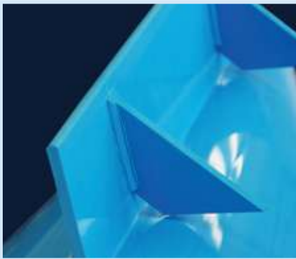
Unterstützungen von Mitnehmern